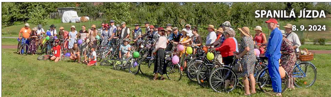
SPANILÁ JÍZDA 8. 9. 2024