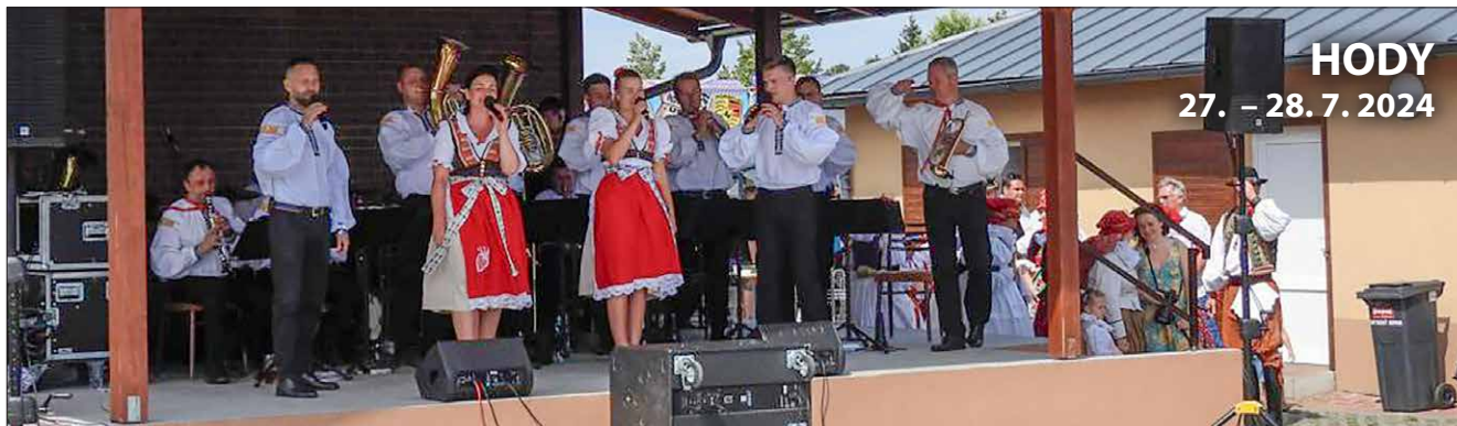
HODY 27. – 28. 7. 2024