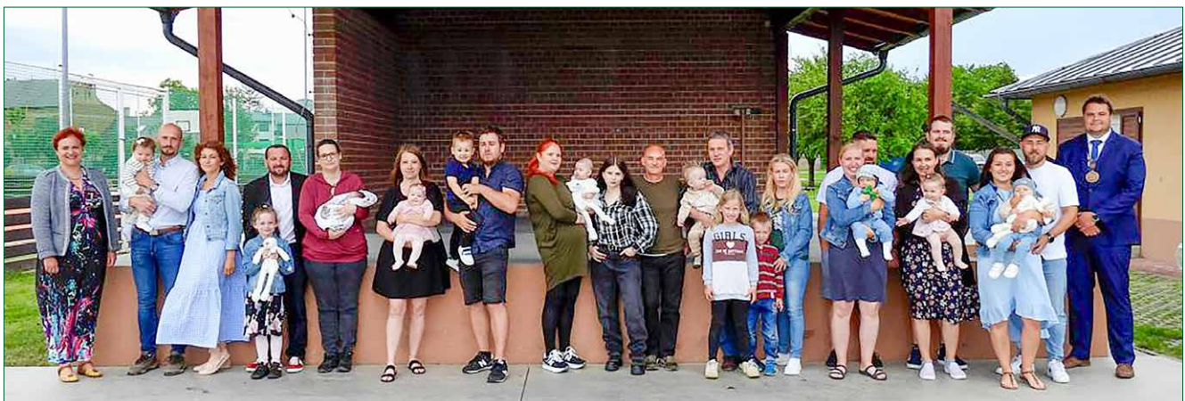
I v letošním roce se naše obec rozrostla o nové občánky a tak mohlo proběhnout tradiční vítání na Rajčudě. Počasí se umoudřilo těsně před samotným ceremoniálem a vše proběhlo v pohodové atmosféře. Dětem přejeme do života zdraví a spokojenost v obci Břest.