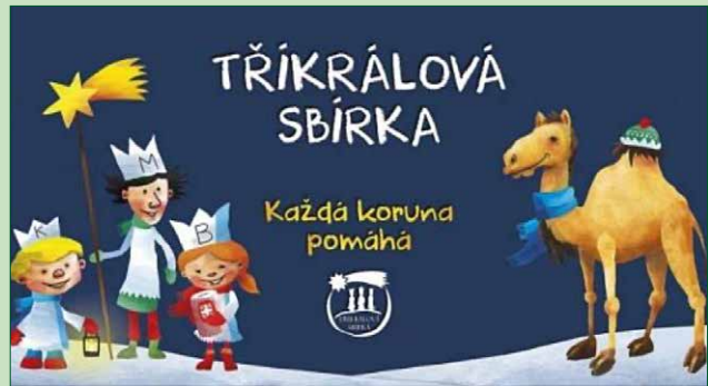
Tříkrálová sbírka v obci Břest vynesla částku 62 433,- Kč, všem dárcům srdečné díky.

Do druhé poloviny roku vstupujeme s optimismem a novými plány. Čekají nás další projekty, které budou pokračovat v rozvoji naší obce. Vaše podněty a nápady jsou pro nás velmi cenné, proto vás vyzývám k aktivní účasti na veřejných diskuzích a setkáních. Váš názor nás zajímá.