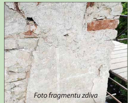
Foto fragmentu zdiva

V tuto chvíli se provádí opravy defektů ve zdivu, zacelují se a zpevňují různé trhliny a zdivo se připravuje na omítání.