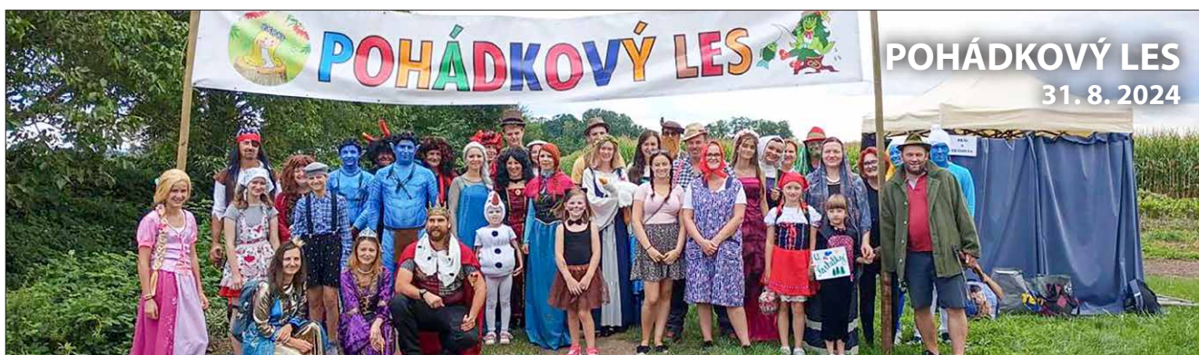
POHÁDKOVÝ LES 31. 8. 2024