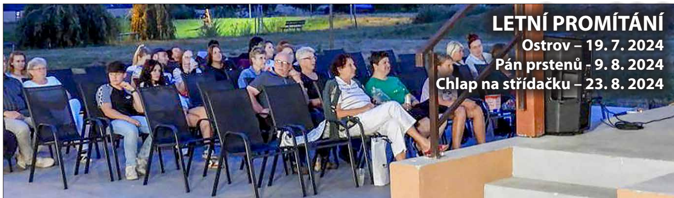
LETNÍ PROMÍTÁNÍ Ostrov – 19. 7. 2024 Pán prstenů – 9. 8. 2024 Chlap na střídačku – 23. 8. 2024

V obecní knihovně proběhne 18. září den otevřené knihovny pro rodiče s dětmi. Můžete se těšit na máňáskové divadlo pro nejmenší.