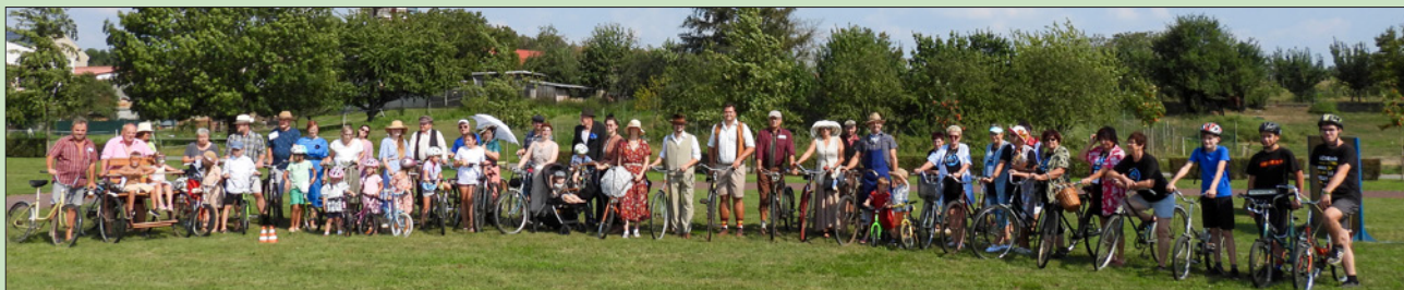
Spanilá jízda po břestských humnech