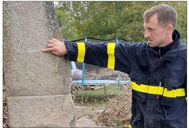
Na soše svatého Floriána ukazuje spodní značka povodeň z roku 1997, na prostřední je letopočet 1903, nejvýše je stopa hladiny z letošního září.

Po záplavách, které postihly nejvíce severní Moravu, nabídli představitelé Hasičského záchranného sboru Zlínského kraje pomoc svým kolegům v zasažených oblastech okresu Jeseník. Město Hulín vypravilo 2 vozidla s veškerou technikou, která by mohla být použita a čtyři členy zásahové jednotky. Záhlinice zastupovali tři hasiči, z Břestu bylo pomáhat celkem sedm členů sboru. Vyjeli jsme ráno ve středu 25. září a měli se hlásit na hasičské zbrojnici v Jeseníku. V projíždějících obcích byl vidět obraz zkrávy,