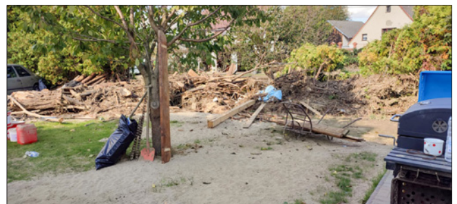
Vidnávka v některých částech pohraničního městečka natropila opravdu velké škody. Palivové dřevo nachystané na zimu majiteli odplavalo, řeka k jeho domu donesla všechno, co posbírala na horním toku.

V sobotu 26. září jsme pořádali zájezd nejen pro hasiče. Celkem 42 účastníků navštívilo přečerpávací elektrárnu Dlouhé Stráně. Během exkurze rodinného pivovaru „Hasič“ v Bruntále jsme také ochutnali jejich výrobky. Akci ukončilo pohoštění v naší sportovní hale, zahráli jsme si bowling a během plodné diskuse zhodnotili celodenní zážitky.