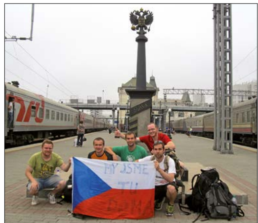
Vladivostok – kilometrovník 9288