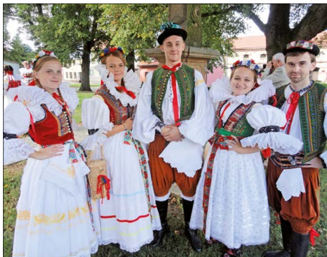
Poděkování za úrodu se letos konalo již podesáté.