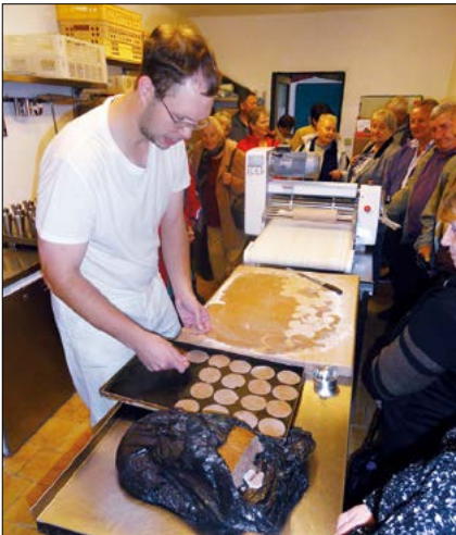
Tak se pečou Štramberské uší

V polovině měsíce září uspořádal obecní úřad zájezd pro naše seniory. Tentokrát jsme se vypravili na celodenní výlet do Kopřivnice, Štramberku a sklárny Karolinka. První zastávka byla ve sklárně v Karolince. Navštívili jsme prostory výroby, kde se sklo leptá a pan průvodce nás seznámil podrobně s postupy prací a historií sklárny.