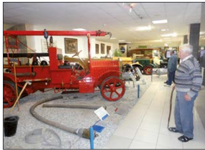
V muzeu Tatra Kopřivnice

Karolinská sklárna s více jak 140 letou tradicí tvořila po celá léta zdroj obživy pro mnoho lidí v místě i okolí. Mistrovství zdejších sklářů bylo a je známé i za hranicemi naší republiky. Hlavní sortiment sklárny představuje užitkové stolní sklo a to především leptané a malované. K malování se používají preparáty z drahých kovů - pravého zlata a platiny - pro docílení speciálních efektů. Po prohlídce jsme navštívili i firemní prodejnu, kde jsme již viděli finální výrobky. Za všechny mohu potvrdit, že bylo na co se dívat. Kdo měl zájem, mohl i sklo zakoupit.