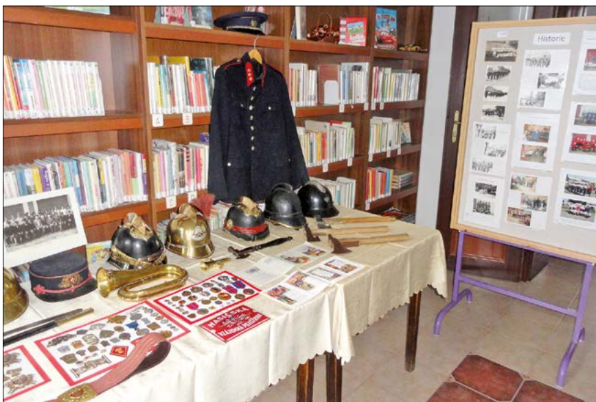
V místní knihovně byly k vidění zajímavé exponáty.