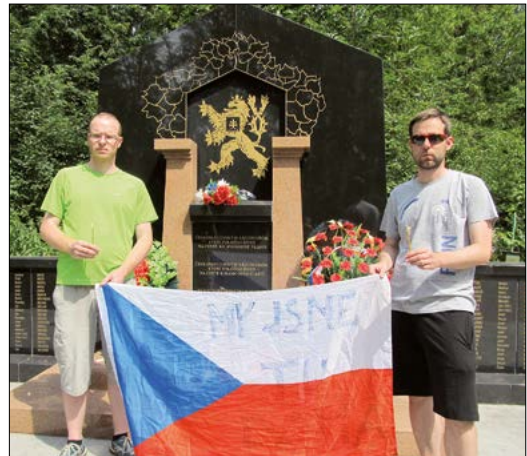
Jekatěrinburg – památník legionářům